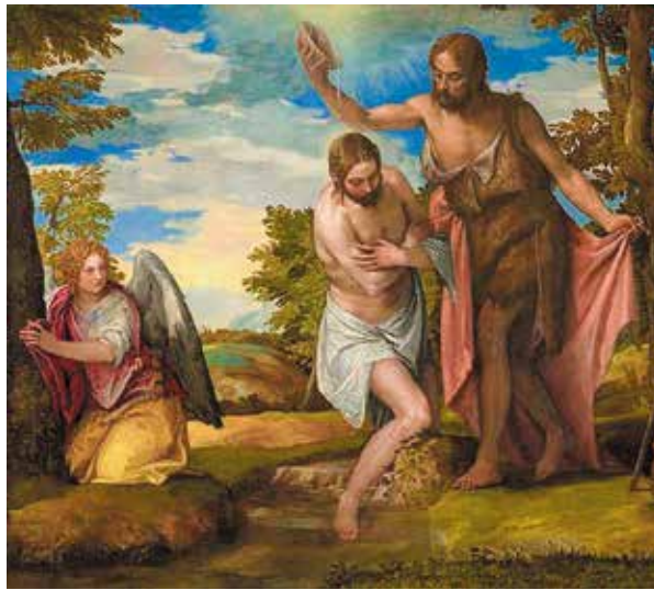
Паоло Веронезе. «Крещение Христа»