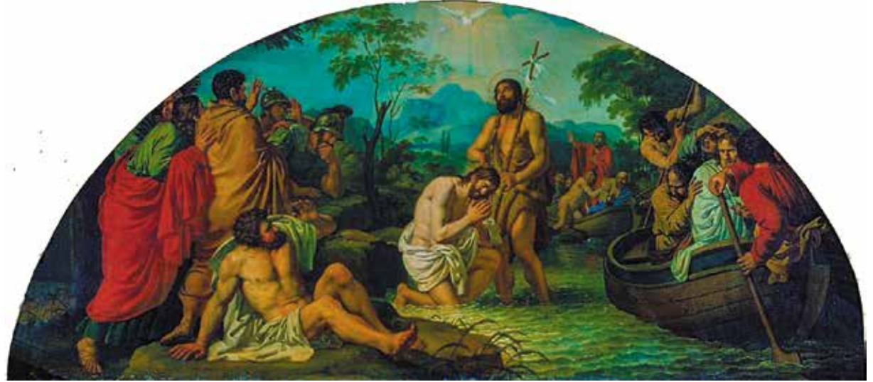
Андрей Иванов. «Крещение Спасителя»

Многие художники мира изображали на своих картинах Крещение Господне – великое Евангельское событие. Создавая картины на религиозный сюжет, художники пытались увидеть его через призму понимания Святого Писания.