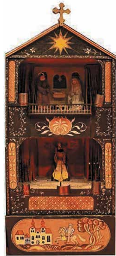
Театр «Бродячий вертеп»

Вертеп был и остаётся одной из любимых традиций празднования Рождества. И каким бы он ни был, статичным, механическим или даже живым, с участием актёров-людей, для зрителя он, прежде всего, — чудесный знак, указывающий на ту самую, Вифлеемскую, пещеру.